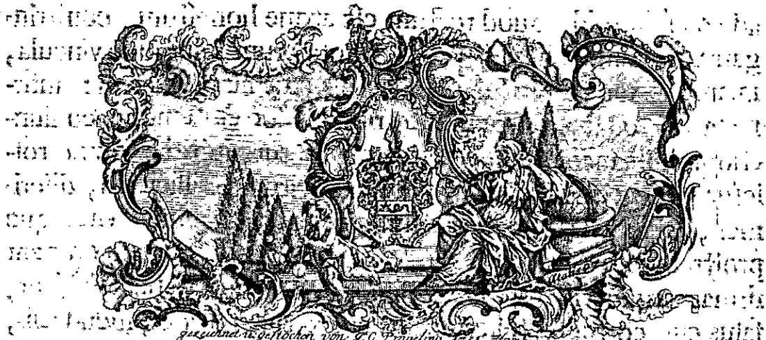
aus dem Original gezeichnet von J. C. Engeling, 1731. Hand.